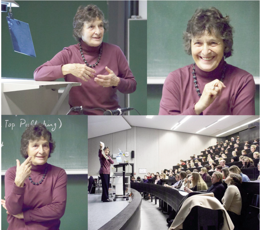
Gastvortrag in Aachen Dezember 2007