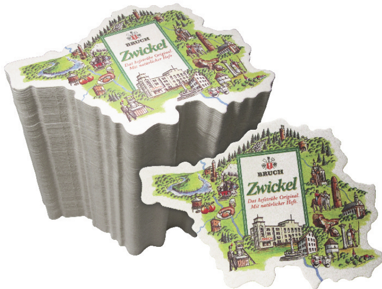
Abb.2: Der Saarlandbierdeckel © Brauerei G.A. Bruch

Wie an den Beispielen deutlich geworden sein sollte, wird der Begriff des Stils bei Barbara Sandig in einem sehr weiten Sinne verwendet, einem Sinne, der zum Beispiel den Begriff der Textsorte oder des Textmusters miteinschließt. Ein Textmuster – wie z.B. eine Schlagzeile, ein Wohnungsinsert oder ein Kündigungsschreiben – ist nach Sandig (2006, 488) „ein standardisiertes (konventionelles) Muster zur Lösung von Standardproblemen [...], die in einer Gesellschaft immer wieder auftreten.“ Textmuster sind nach Sandig holistisch zu beschreiben, es sind „komplexe sinnhafte Gestalten [...], die aus sehr verschiedenen Eigenschaften bestehen“ (ebenda). Textmuster sind damit nicht-kompositionale Objekte, die in einer kognitiven Grammatik über Frames und Scripts repräsentiert werden können und aufgrund ihres konventionalisierten, zum Teil auch normativen Charakters prototypisch organisiert sind (vgl. auch Sandig 2008). Analoges gilt für den Begriff des Stils (vgl. z.B. Sandig 2006, 86, oder ausführlicher Sandig 2007): „Stil [besteht] aus einer charakteristischen Struktur: Diese entsteht aus einer begrenzten Menge konkurrierender Merkmale, die zusammen als Gestalt [im psychologischen Sinne, I.R.] interpretierbar sind. Diese Gestalt (oder der Gestalt-